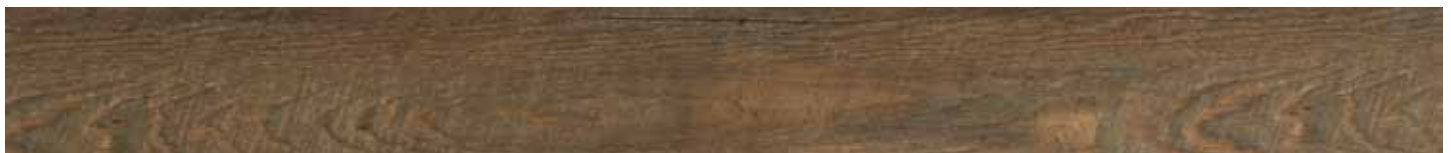
DAKOTA HICKORY • B3031487