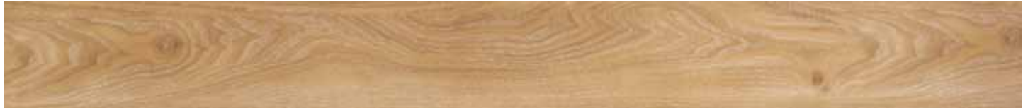
ASPEN OAK • B3081482