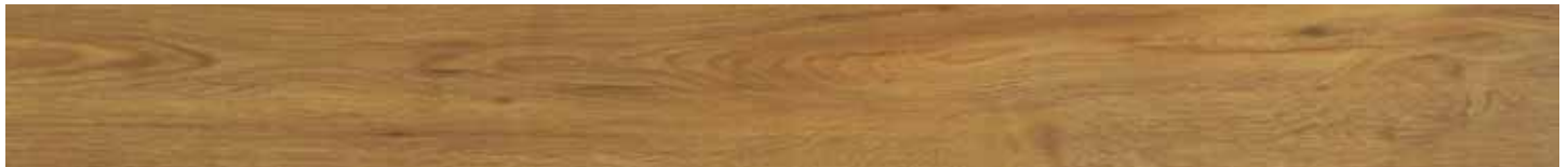
AVIGNON OAK NATURAL • B3091481