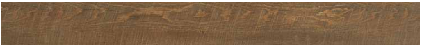
ARIZONA HICKORY • B3041486