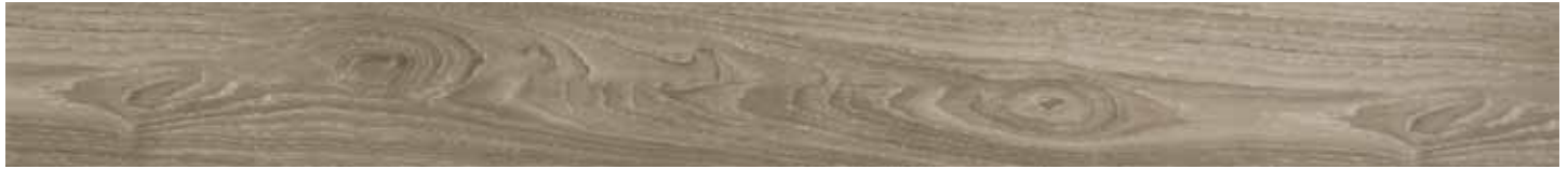
ASPEN OAK SILVER • B3001480