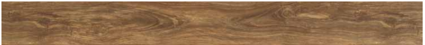
VINTAGE OAK • B3051485