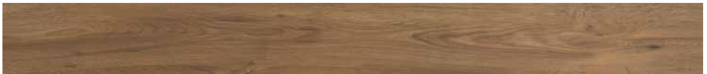
AVIGNON OAK • B3061484