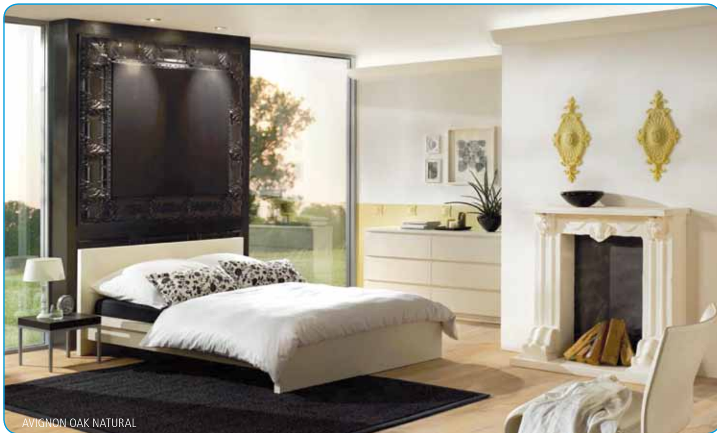
AVIGNON OAK NATURAL

Die Starclac Designboden Collection überzeugt mit ausgewählten, im Trend liegenden Holz- und Steinnachbildungen, einem hohen Komfortwert und allen Vorteilen eines technisch ausgereiften Vinyl-Bodenbelages.